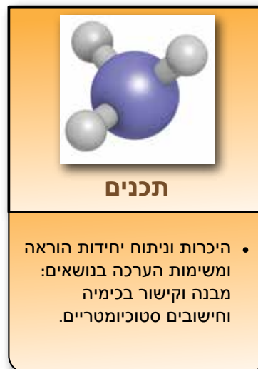
איור 1: הדגשים בקורס דרכי הוראת הכימיה 1